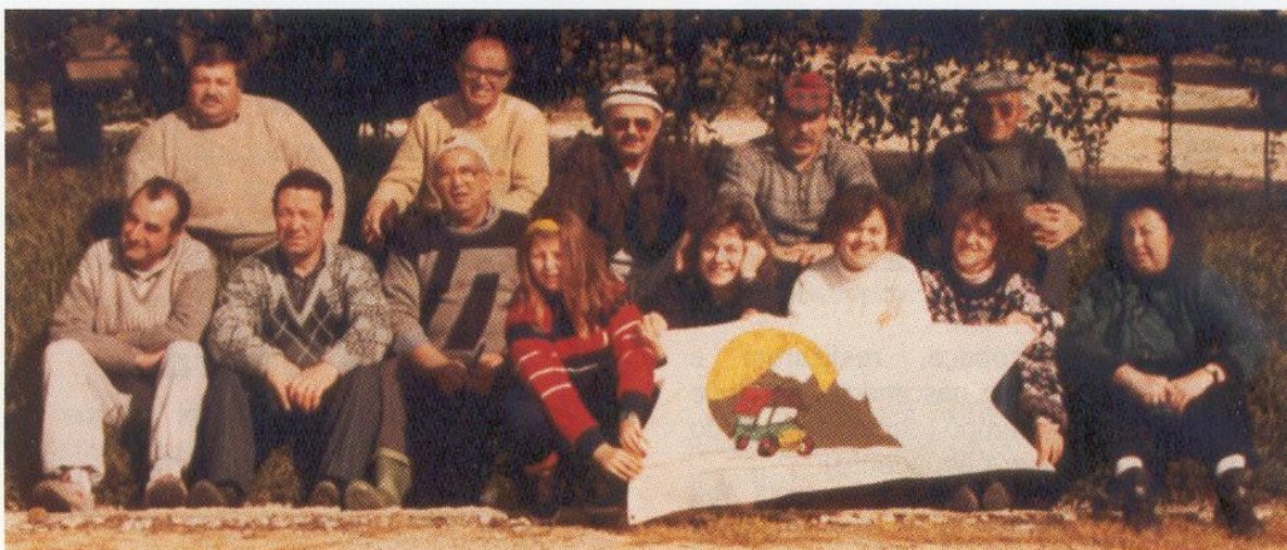
Sócios-fundadores (da esquerda para a direita, e de cima para baixo):