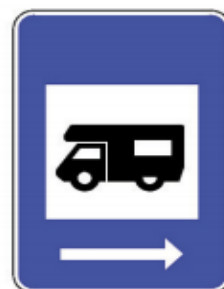
H14d-Área de serviço para autocaravanas