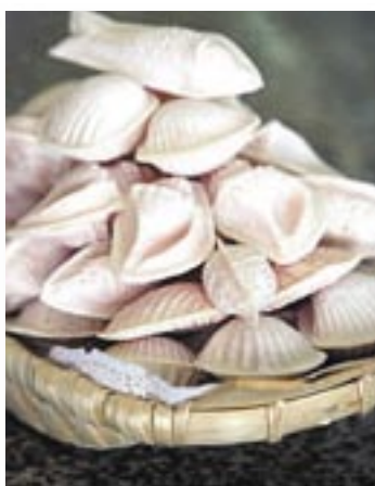
Ovos Moles - doçaria regional

Barcos típicos, metade dos quais portugueses, vão estar atracados em Aveiro, de 27 a 29 de Julho, transformando os canais da cidade num museu vivo de artes náuticas durante as Festas da Ria, cujo ponto alto é a tradicional Regata do Moliceiro no dia 28. A Regata inicia-se na Torreira pelas 14h e termina em Aveiro, onde chegará pelas 16h.